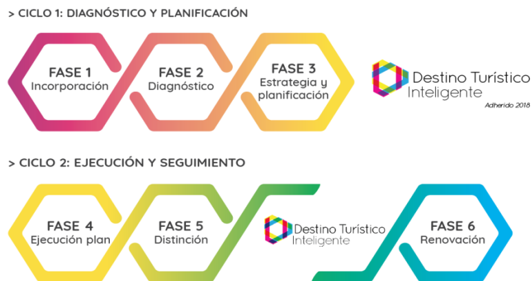
Gráfico 1. Metodología DTI.

Con este objetivo, y previa firma de un convenio de colaboración entre el Ayuntamiento de Valladolid y SEGITTUR, se inició el proceso de implantación de la metodología DTI, conforme se describe en el siguiente gráfico.