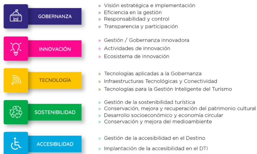
Gráfico 2. Ambitos de evaluación, por ejes de la metodología DTI.

Así, en un primer paso, se procedió a la elaboración de un diagnóstico del destino según el grado de cumplimiento de los requisitos que contempla la metodología por ejes, para lo que SEGITTUR analizó en profundidad la información solicitada al Ayuntamiento de Valladolid a través de cuestionarios por eje. Para la evaluación de requisitos se ha trabajado sobre una batería de más de 96 ítems, agrupados en 16 ámbitos de evaluación para los cinco ejes de un DTI: gobernanza, innovación, tecnología, sostenibilidad y accesibilidad.